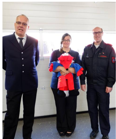
Fotos: aktueller Arbeitskreis und Führungsteam